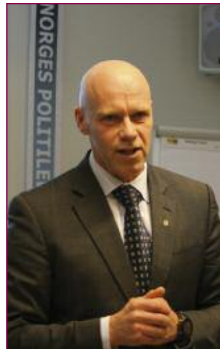
Terje Nybø, førstestatsadvokat, Riksadvokatembetet.